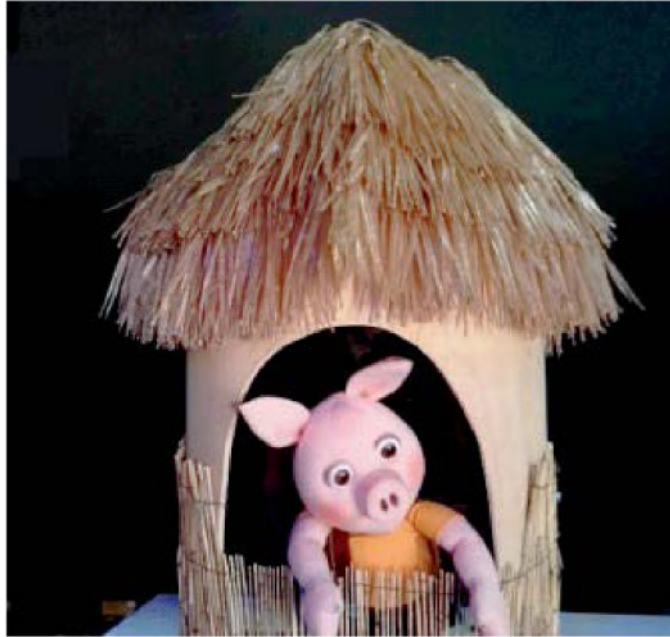
"FAVOLE&TAMBURI" Il 6 gennaio di scena "I tre porcellini"