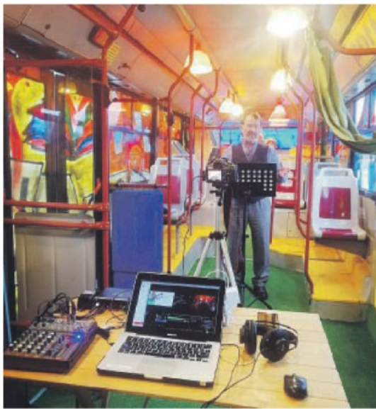
IN GIRO PER LA CITTÀ Il ricco cartellone degli appuntamenti organizzati dal Crest per le feste